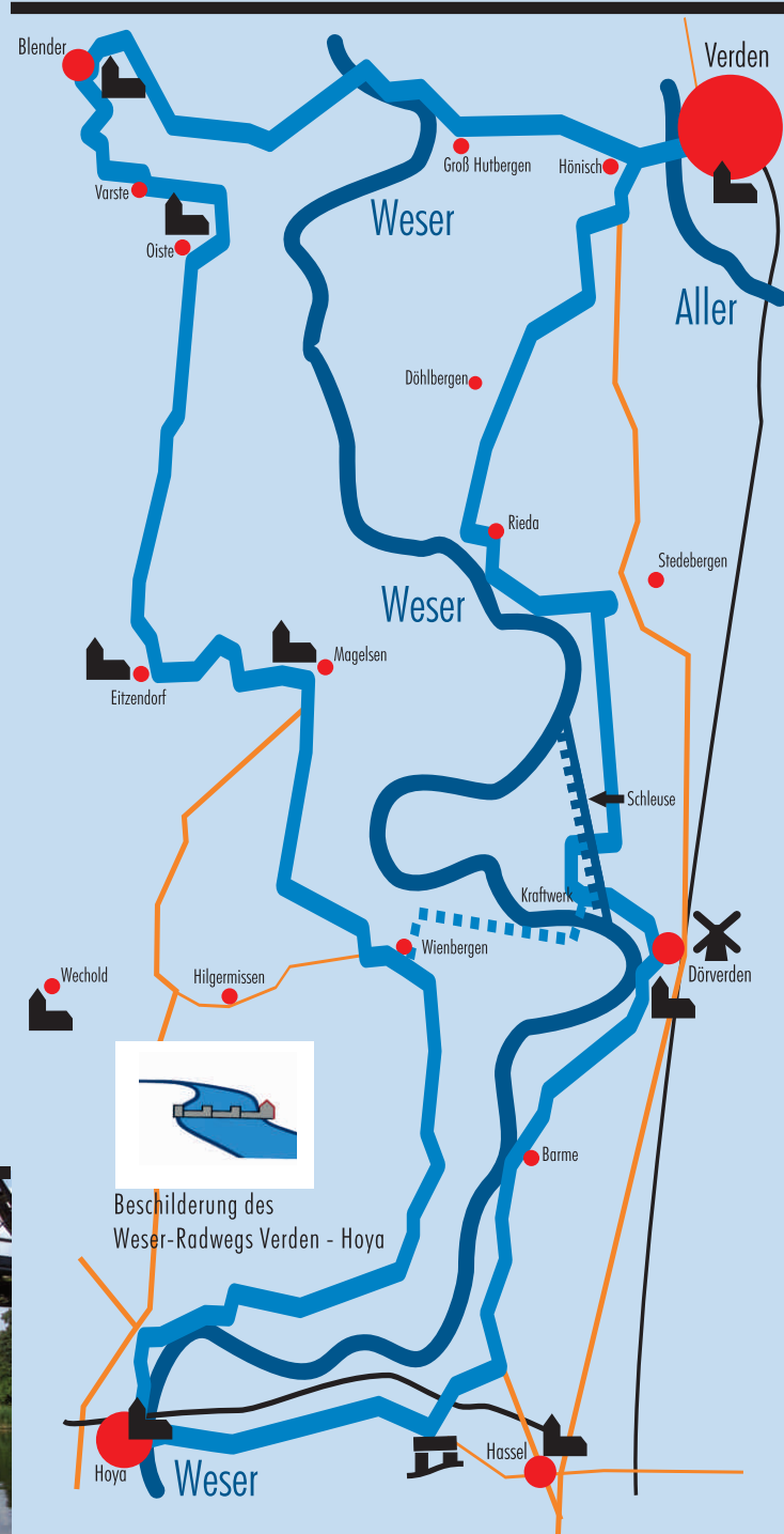
Beschilderung des Weser-Radwegs Verden - Hoya